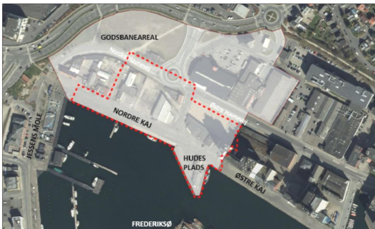
Figur 2. Forsyningsområdet er vist med rød stiplede linje. Det grå område markerer afgrænsningen af området som er omfattet af helhedsplanen.

Ledningen placeres, så respektafstand til eksisterende naturgas-, el-, vand- og spildevandsledninger m.m. overholdes.